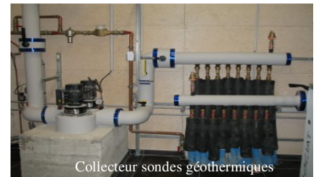
Collecteur sondes géothermiques