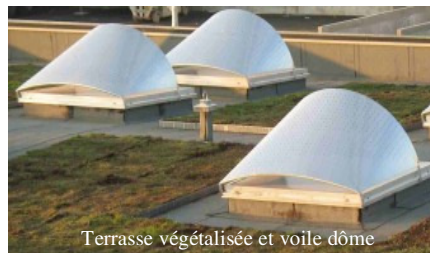
Terrasse végétalisée et voile dôme