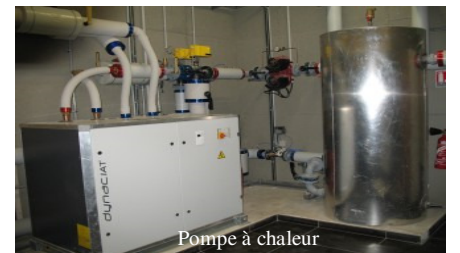
Pompe à chaleur